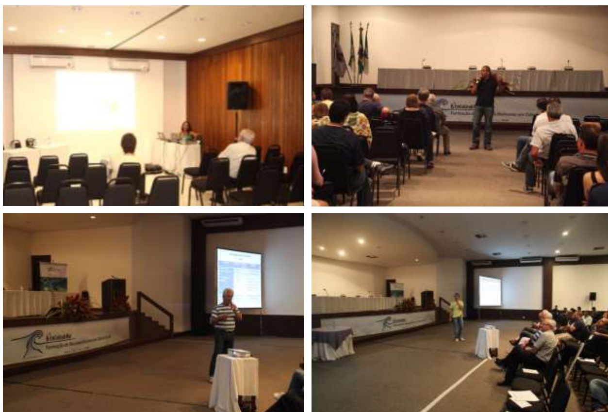
Figura 22: Reunião do GT Mercado de Trabalho por ocasião do 5º Workshop dos GT do PPG-Mar (02.12.2013) e participação na sessão plenária ocorrida no âmbito do 6º EnCoGrad-Mar (05.12.2013).